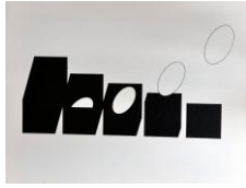
attila kovács (* 1938)