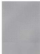
heiko tappenbeck (*1936)